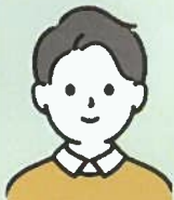
Kさん 公務員特別科 (長崎県立大学卒)

公務員試験に向けた勉強を今までしたことが無かったので単独で勉強して試験に受かる自信がなかったのが一番の理由です。転職をする際に、何か1つでも良いので、前職で培った経験を生かしたアピールポイントを作っておくのが良いと思います。面接の際に、新卒ではない場合は、必ずと言っていいほど前職の事を聞かれます。