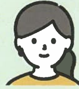
Uさん 公務員本科 (佐世保北高校卒)

筆記) 判断・数的は解くしかありません。数をこなして、問題を見てすぐに手を動かせるよう訓練しました。 面接) 志望動機を考えるのが大変でした。志望先のHPをみて、先生方にチェックしてもらいました。緊張しすぎてしまうので先生方の面接練習や本試験で経験を積んだ。声に出しながら練習しましょう。